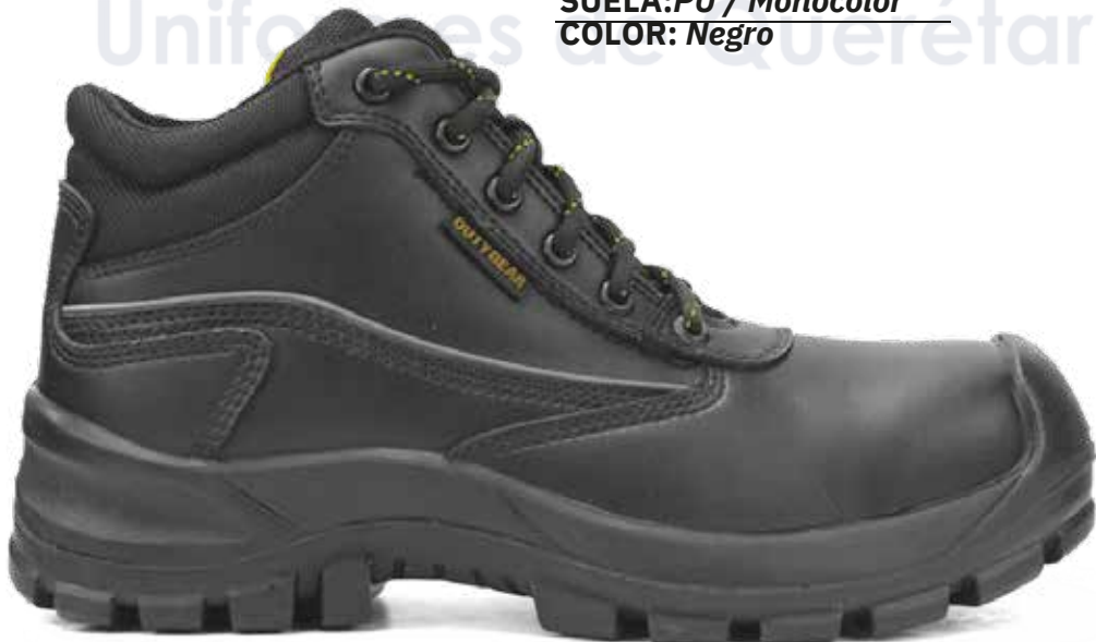
EST 2267 TALLAS:22-31 / Micropiel SUELA:PU / Monocolor COLOR: Negro