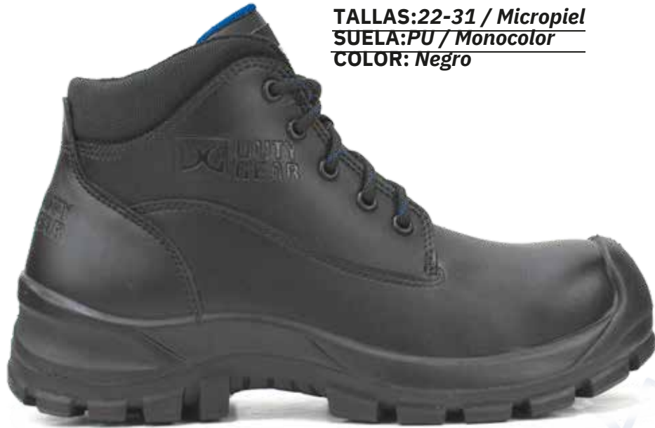
EST 2277 TALLAS:22-31 / Micropiel SUELA:PU / Monocolor COLOR: Negro